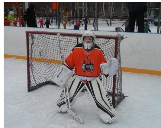
Оснащение оборудованием спортивной секции «Хоккей с шайбой», город Екатеринбург