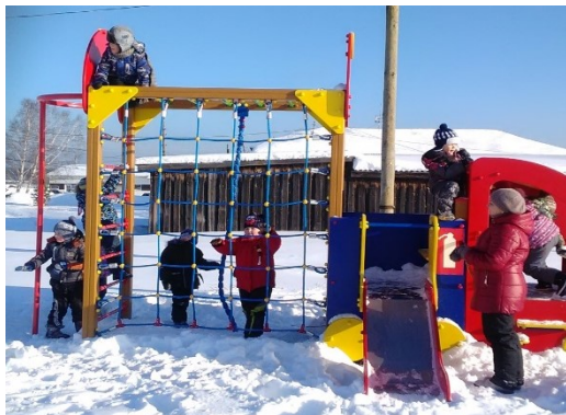
«Благоустройство территории для общественных мероприятий, в том числе детской площадки на территории Невьянской сельской администрации по адресу: с. Невьянское, пер. Молодежный, 5», Муниципальное образование Алапаевское