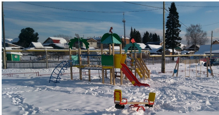
«Обустройство детской площадки, расположенной по адресу: пос. Валериановск, ул. Горняков, в районе д. 17», Качканарский городской округ