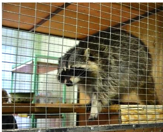
«Тактильный зоопарк» МБУДО «Станция юных натуралистов» Асбестовского городского округа