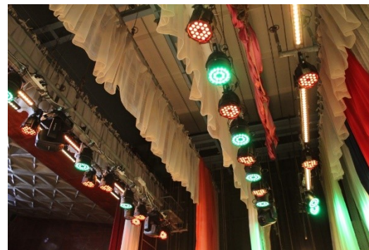
«Засветись» (замена светового оборудования сцены зрительного зала), городской округ Краснотурьинск