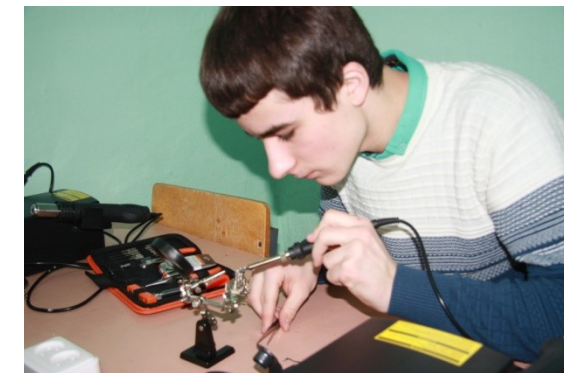
«Создание и оснащение технической лаборатории «Радиотехника» («От Технолаба к Технопарку») (городской округ Карпинск)